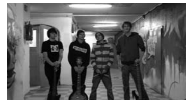
JUNGE MUSIK