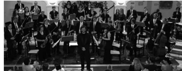
Orchesterverein Feldkirchen.