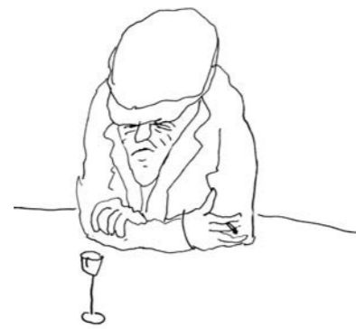
Bukoschek: So mancher hinterlässt eine Lücke, die ihn vollkommen ersetzt