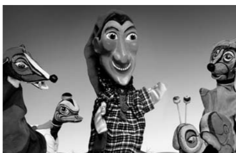
Kasperl mit seinen Freunden